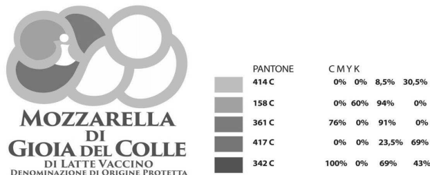
Fig.1 Logo e Tavola cromatica

1. Sulle confezioni deve essere apposto, all'atto dell'immissione al commercio, il logo grafico che costituisce parte integrante del presente disciplinare di produzione, a garanzia della rispondenza alle specifiche prescrizioni normative, accompagnato dalla data di produzione.