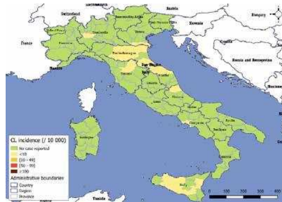
Figura 1: distribuzione geografica dei casi umani di Leishmaniosi cutanea e viscerale nel 2016 ( www.who.int/leishmaniasis/Map-CL-Ita-2016.png )